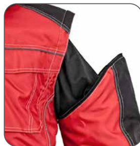
odepínací rukávy odnímateľné rukávy detachable sleeves odpinane rękawy