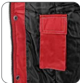
vnitřní kapsa vnútorné vrecko inner pocket kieszeń wewnętrzna