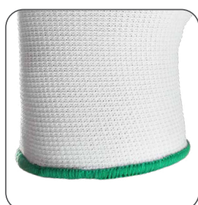
pružná manžeta pružná manžeta elastic cuff mankiet elastyczny