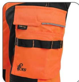
multifunkční kapsy multifunkčné vrecká multifunctional pockets kieszenie wielofunkcyjne