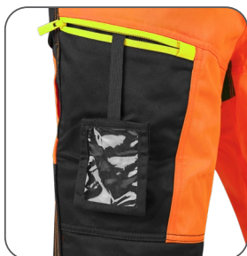
stehenní kapsa s vnitřním pouzdem na ID kartu stehenné vrecko s vnútorným držiakom na ID kartu thigh pocket with inner ID card holder kieszeń na udzie z miejscem na ID kartę