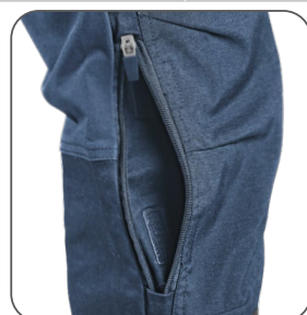
kolenní kapsy s boční ventilací a možností vložení kolenních výztuh kolenné vrecká s bočnou ventiláciou a možnosťou vloženia kolenných výstuh knee pockets with side ventilation and possibility to insert knee pads kieszenie na kolanach z boczną wentylacją i możliwością włożenia nakolanników