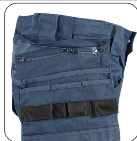
odepínací kapsy odnímateľné vrecká detachable pockets odpinane kieszenie