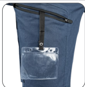
stehenní kapsa s vnitřním pouzdem na ID kartu stehenné vrecko s vnútorným pouzdom na ID kartu thigh pocket with inner ID card holder kieszeń na udzie z miejscem na ID kartę