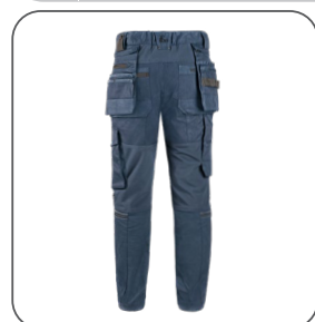
zadní strana zadná strana back side z tyłu